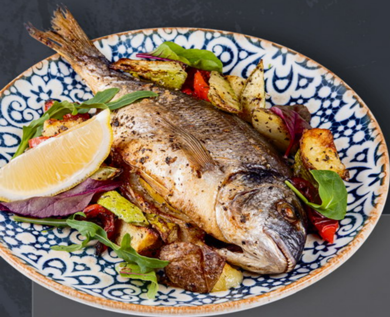
Дорадо с запечёнными овощами NEW