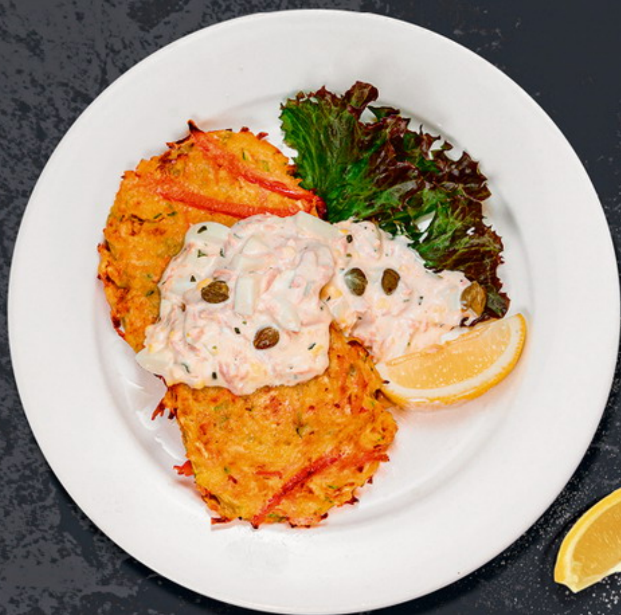
Оладьи овощные с тунцом