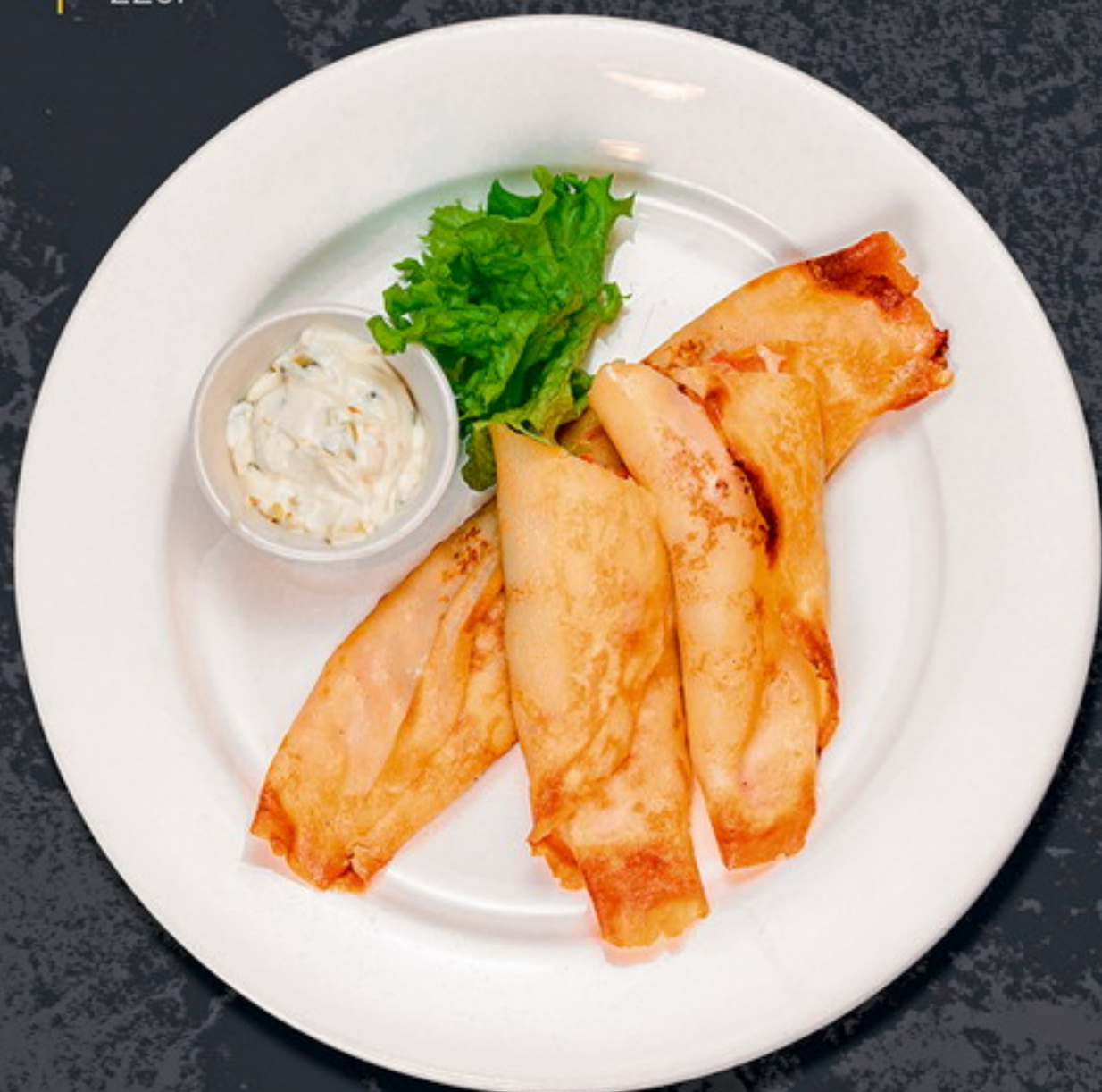
Блины «Четыре сыра»